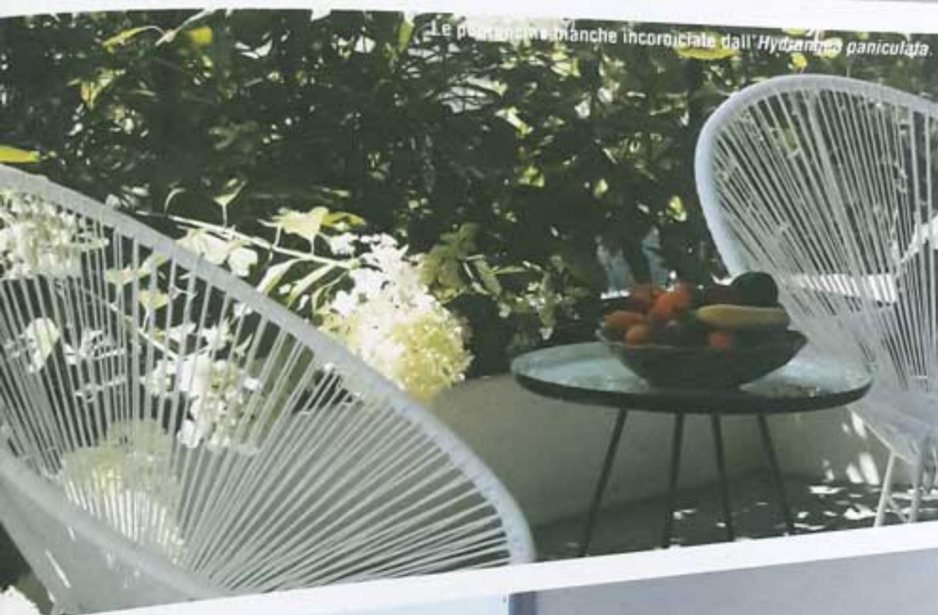
Le piantare in bianco incorniciate dall' Hydrangea paniculata .