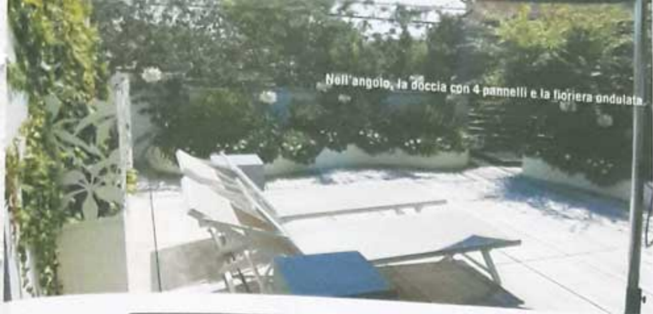
Nell'angolo, la doccia con 4 pannelli e la fioriera ondulata.