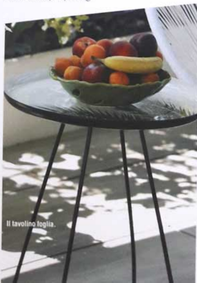
Il tavolino foglia.