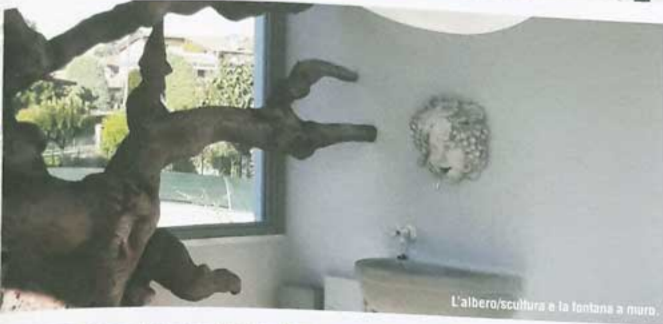
L'albero/scultura e la fontana a muro.