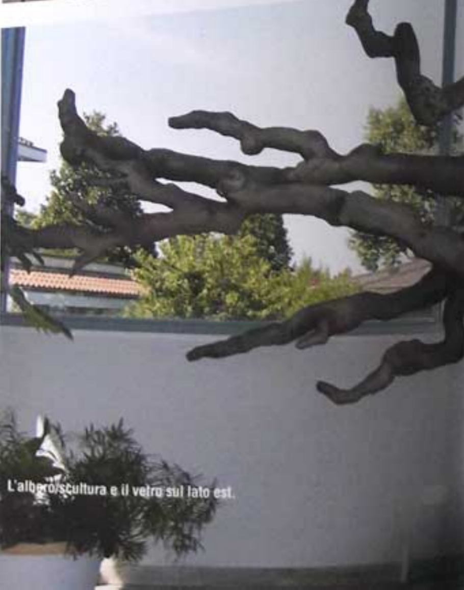
L'alberoscultura e il vetro sul lato est.